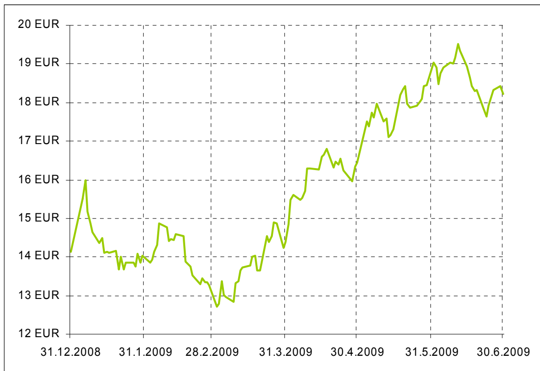
Gibanje VEP podsklada Krekov most novi trgi

Donosnost podsklada Krekov most novi trgi na dan 30.06.2009: