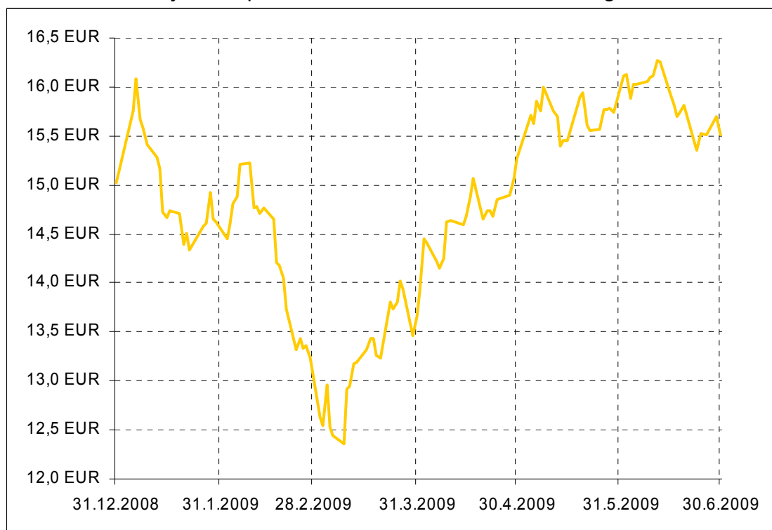
Gibanje VEP podsklada Krekov klas družbeno odgovorni

Donosnost podsklada Krekov klas družbeno odgovorni na dan 30.06.2009: