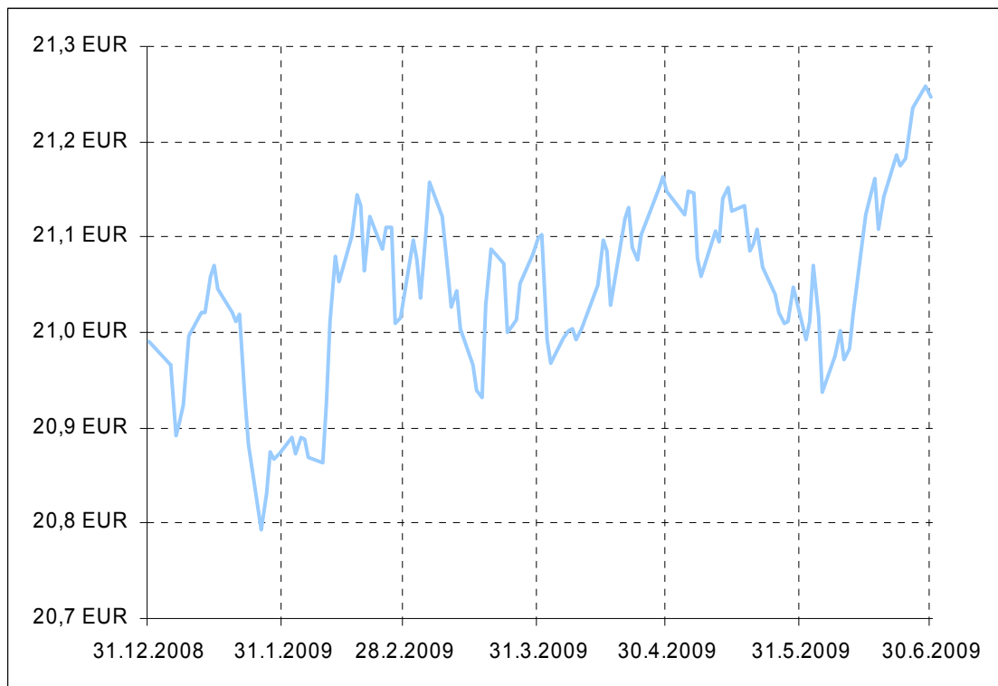
Gibanje VEP podsklada Krekov sidro obvezniški

Donosnost podsklada Krekov sidro obvezniški na dan 30.06.2009: