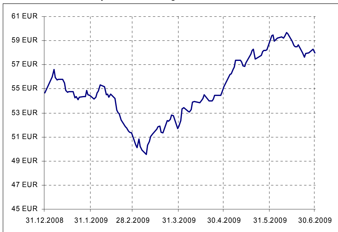
Gibanje VEP Krekovega Skala Uravnoteženi

Donosnost podsklada Krekov skala uravnoteženi, mešani podsklad na dan 30.06.2009: